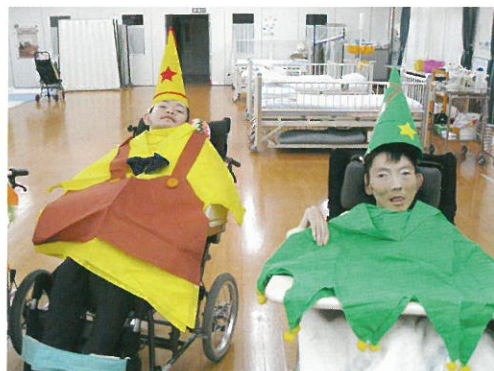
ピノキオ（左）とピーターパン（右）に变身☆