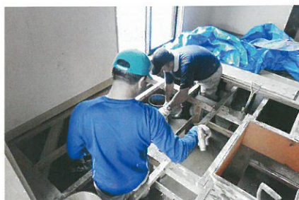
写真の掲載については FB 津久見市災害ボランティアさまに許可をいただきました