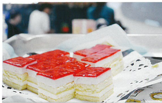
たくさんのスイーツが並びました